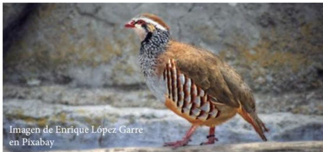
Imagen de Enrique López Garre en Pixabay

En cuanto a mamíferos, reptiles y anfibios, estas tierras cuentan con numerosas especies dispersas por la pluralidad de hábitat existente, así podemos encontrar la presencia de topo ibérico, corzo, jabalí, conejo, liebre, zorro, lagarto verde, culebra de escalera, sapo partero, sapo corredor, etc.