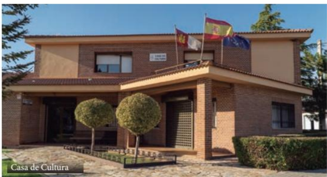
Casa de Cultura